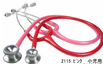
2115:ピンク 小児用 2114R:レッド 新生児用