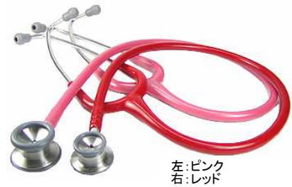
左:ピンク 右:レッド